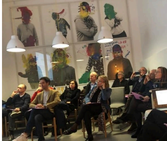
Reunió del Consell Social de la fundació, el 10 de gener de 2019 a les instal·lacions del carrer Lepant 151