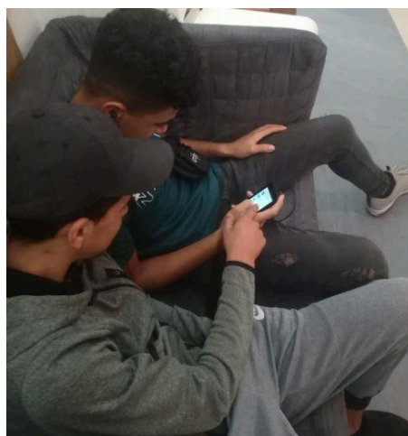
Adolescents emigrats sols del Centre “Dar Chabab” de Barcelona, que participa en el projecte

El projecte vam començar a impulsar-lo des d'iSocial a finals de 2018, i durant 2019 vam articular el partenariat i buscar fonts de finançament. Després d'obtenir el suport de la Secretaria d'Infància, Adolescència i Joventut de la Generalitat, i d'aconseguir finançament de la Fundació Fèlix Llobet i Nicolau, i de l'Obra Social La Caixa, el 15 d'octubre vam iniciar el projecte, amb els sis partners següents: Escola de Treball Social de la Universitat de Barcelona; Màster de desenvolupament d'App de la Universitat Oberta de Catalunya; Fundació Idea; Associació Punt de Referència; Grup Sant Pere Claver; Associació de Joves extutelats de Catalunya. També col·laboren en el projecte la Fundació Grífols i la Fundació Save The Children. La durada del projecte és de 18 mesos.