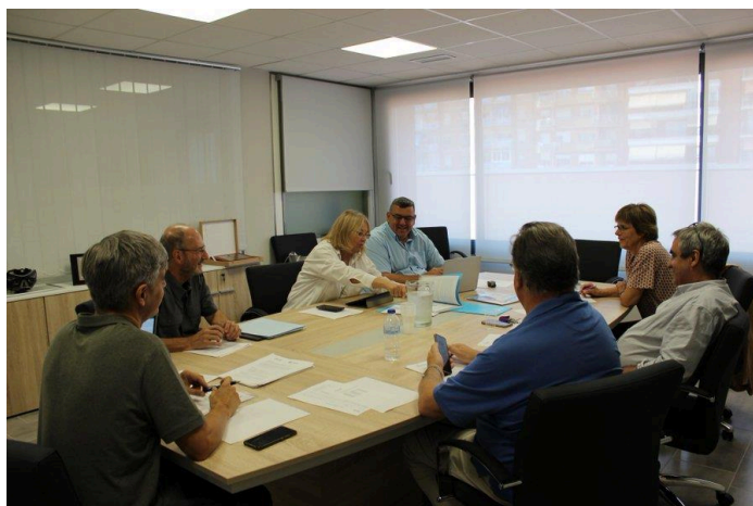
Reunió del Patronat de la fundació, el 19 de setembre de 2019 a la seu de la Fundació Joia a Barcelona