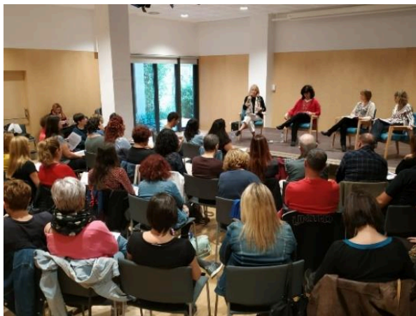
Sessió inaugural del curs a El Prat, el 25 d'octubre, consistent en una taula rodona de debat amb tres professionals de l'atenció primària.