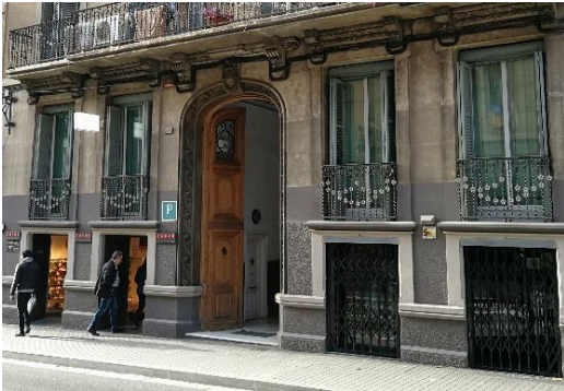
Seu social actual de la fundació, situada al número 239 del carrer Gran de Gràcia de la ciutat de Barcelona.

El mes de juliol vam deixar la seu del carrer Lepant 151 i vam traslladar-nos a un despatx de les oficines del Grup ATRA, al 1r pis del carrer Gran de Gràcia 239 de Barcelona.