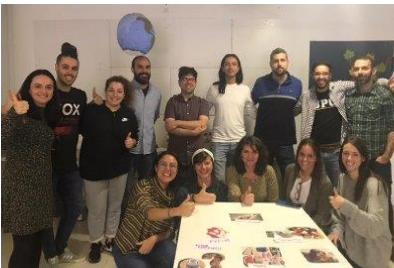
Sessió de treball el 31 d'octubre de partners del projecte "Caixa d'eines digitals per a adolescents i joves emigrats sols", liderat per iSocial. Per a aquest projecte hem establert un acord de partenariat amb altres 6 organitzacions